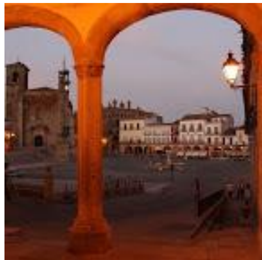
Trujillo: Plaza Mayor