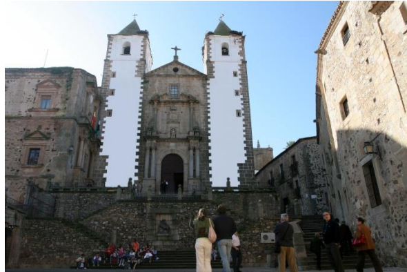
Plaza de San Jorge.