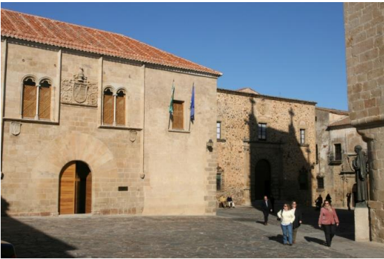
Plaza de Santa María.