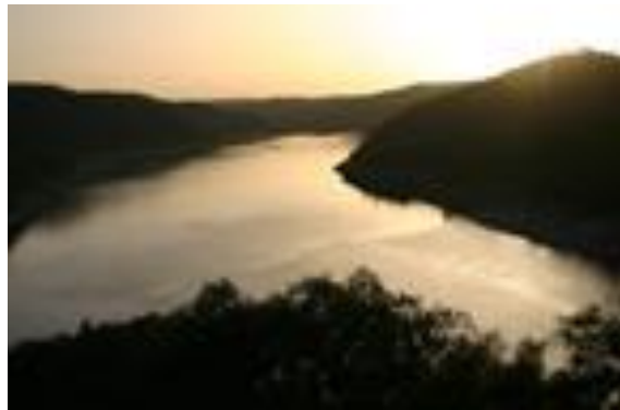
Parque Nacional de Monfragüe